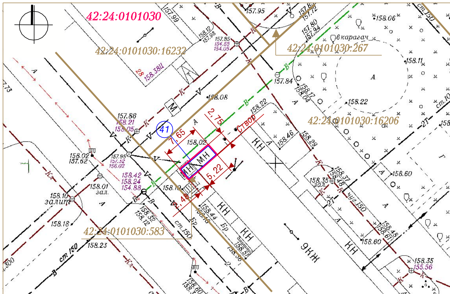
СХЕМА РАЗМЕЩЕНИЯ НЕСТАЦИОНАРНОГО ТРГОВОГО ОБЪЕКТА, ГРАФИЧЕСКОЕ ИЗОБРАЖЕНИЕ М 1:500