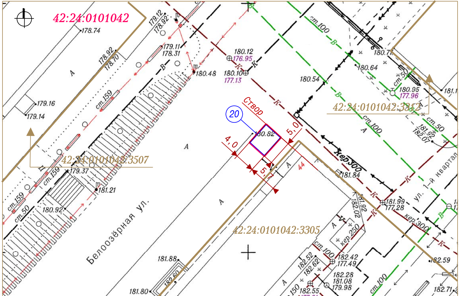
СХЕМА РАЗМЕЩЕНИЯ НЕСТАЦИОНАРНОГО ТОРГОВОГО ОБЪЕКТА, ГРАФИЧЕСКОЕ ИЗОБРАЖЕНИЕ М 1:500