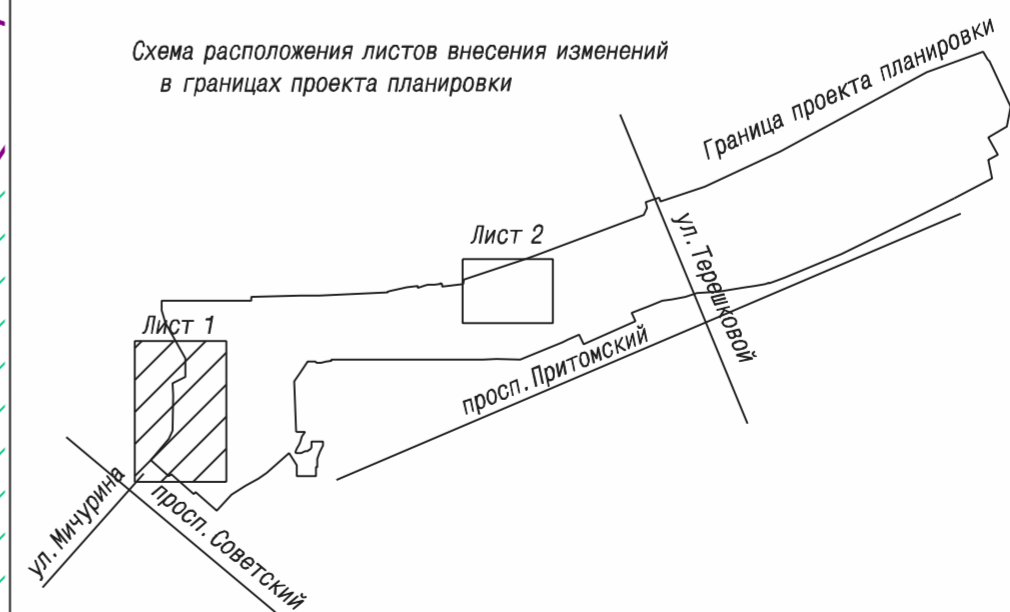
Схема расположения листов внесения изменений в границах проекта планировки