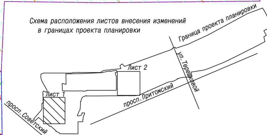
Схема расположения листов внесения изменений в границах проекта планировки