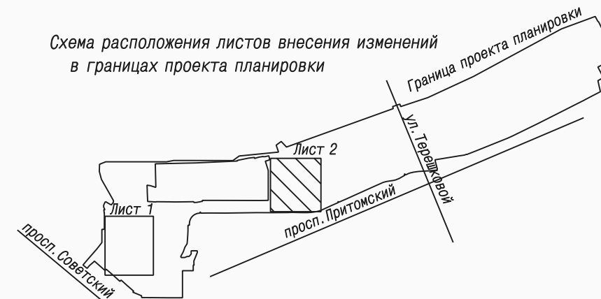
Схема расположения листов внесения изменений в границах проекта планировки