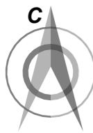
Схема границ участков жилой застройки